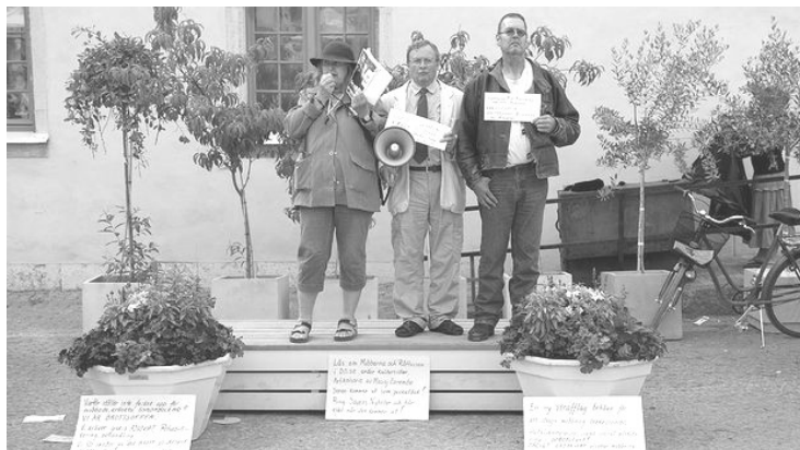
Representanter för OMM pratar under Almedalsveckan